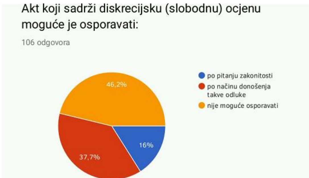
Slika 3. Osnove za osporavanje akta