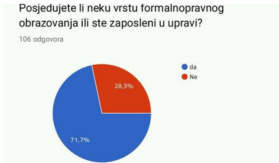
Slika 1. Upućenost ispitanika u pravila upravnog postupka