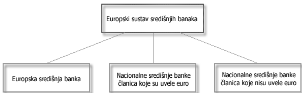
Slika 1. Europski sustav središnjih banaka

Europski sustav središnjih banaka (ESSB) skup je središnjih banaka kojeg čine Europska središnja banka (ESB) i nacionalne središnje banke (NSB) svih članica EU.