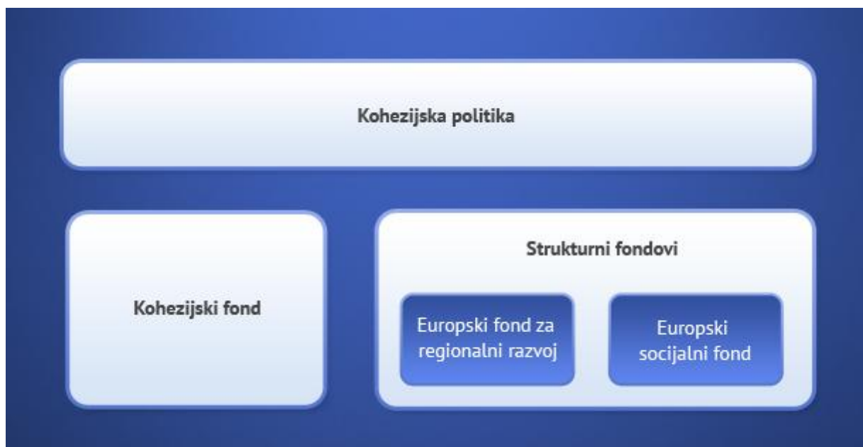
Slika 4. Instrumenti Kohezijske politike

Izvor: http://www.strukturnifondovi.hr/eu-fondovi