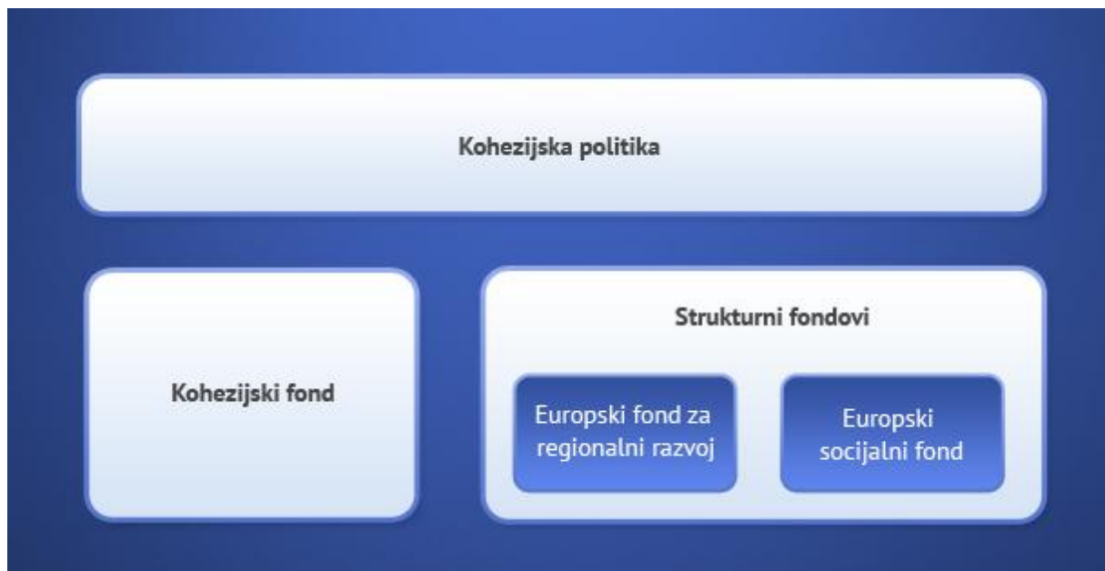
Slika 4. Instrumenti Kohezijske politike