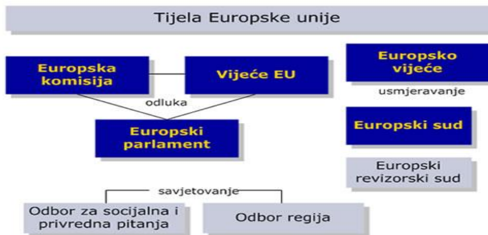
Slika 5. Tijela EU