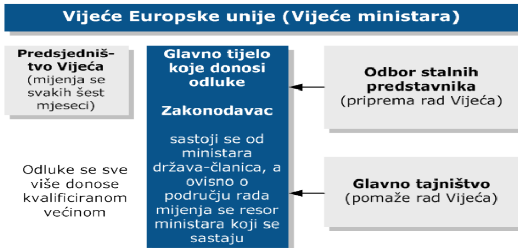
Slika 6. Vijeće Europske unije