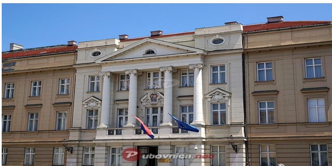
Slika 2 Hrvatski sabor

Svaki ured i državni zavod na čelu ima ravnatelja koji je odgovaran za sve odluke koje donosi njegovo državno tijelo i on koordinira i kontrolira djelatnosti svih podređenih državnih službenika. Prema teritorijalnom ustrojstvu, RH ima 21 županiju kojoj je načelu župan koji je odgovaran za rad pročelnika raznih odjela u sklopu svoje županije. Što se tiče samog školstva, osnivač srednjih škola je županija, a osnovnih grad kojem pripada. Ravnatelja osnovnih i srednjih škola imenuje školski odbor koji čine članovi osnivača, odabrani djelatnici škola i jedan predstavnik roditelja.