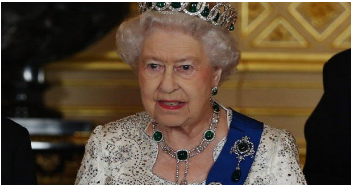
Slika 1 Kraljica Elizabeta II.