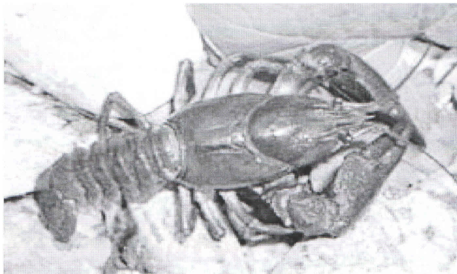
Slika 2. Bjelonogi potočni rak ( actacus actacus )