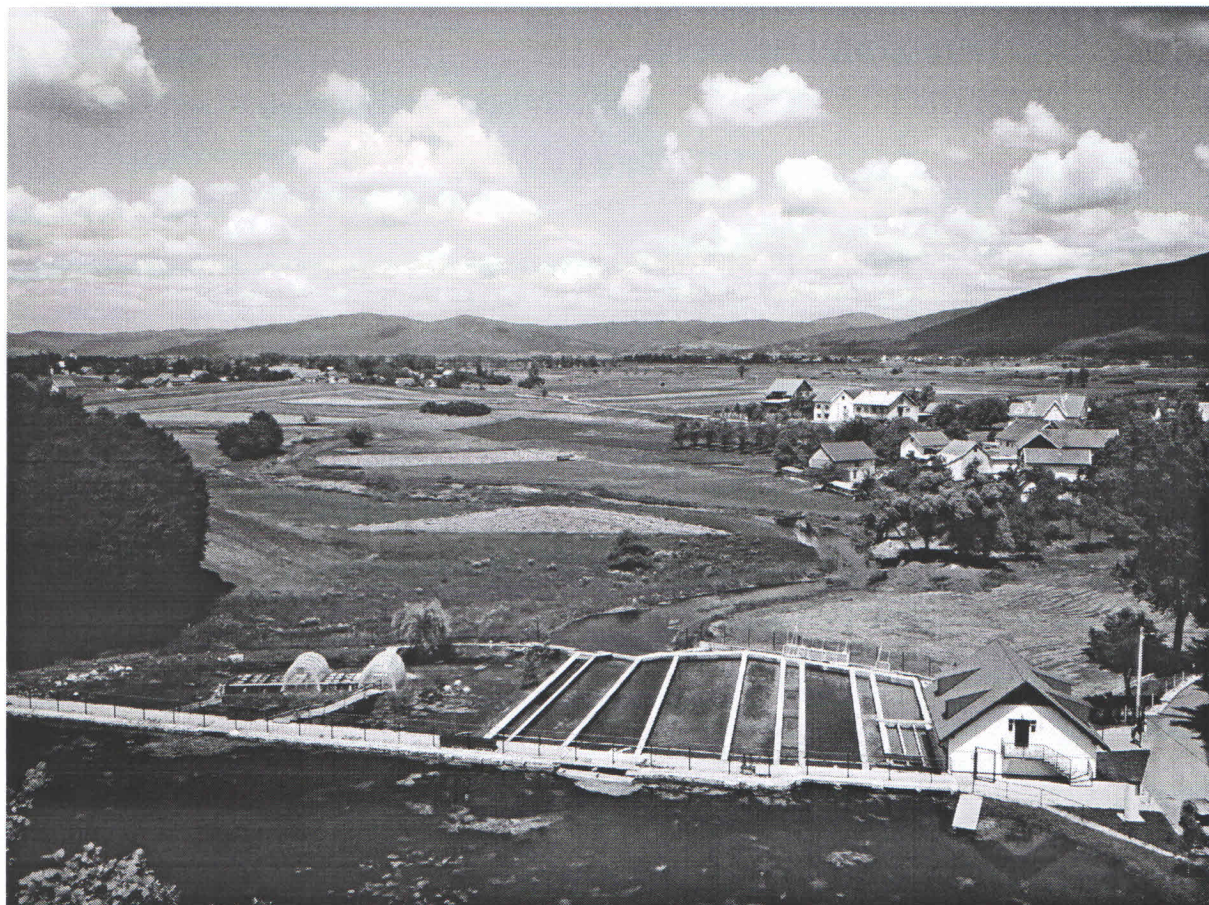
Slika 1. Hrvatski centar za autohtone vrste riba i rakova krških voda Otočac