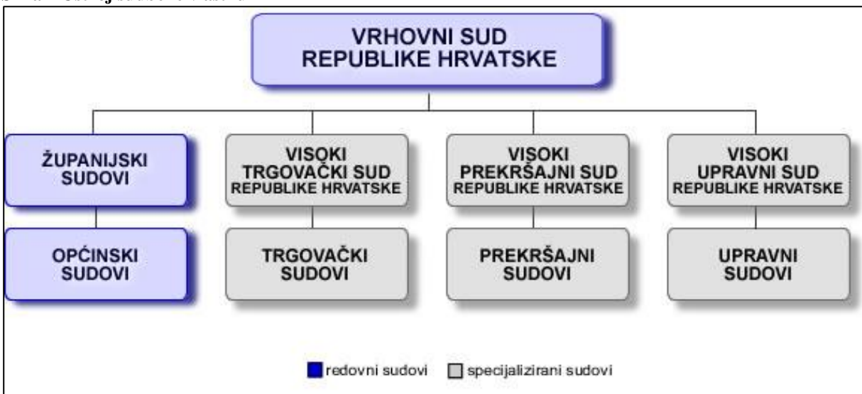
Slika 2 Ustroj sudbene vlasti u RH