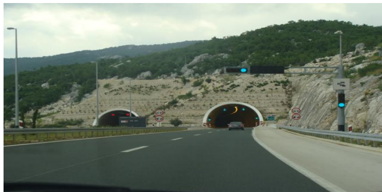
Slika 17. Tunel Crna brda