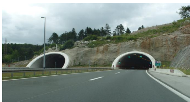
Slika 26. Tunel Grič