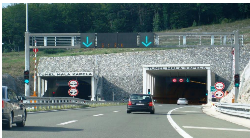
Slika 3. Tunel Mala Kapela