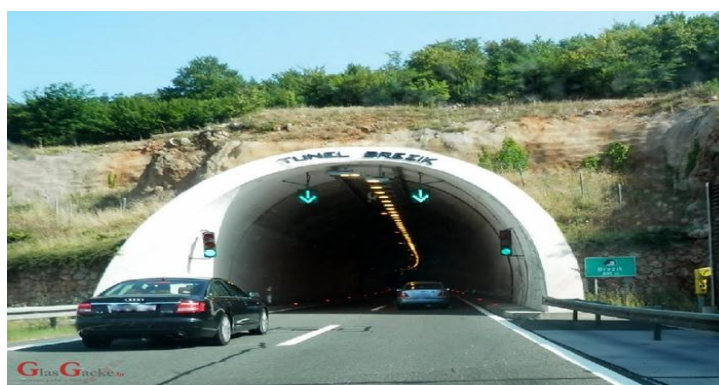
Slika 5. Tunel Brezik