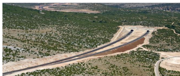
Slika 13. Tunel Dubrave