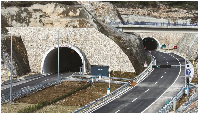
Slika 21. Tunel Šubir