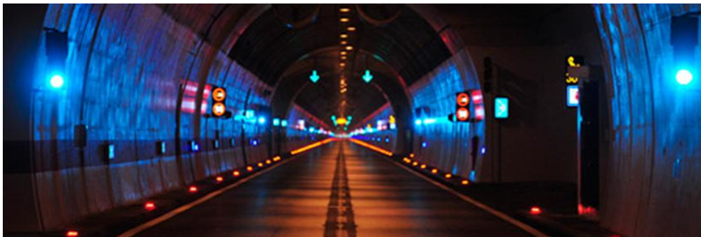
Slika 9. Tunel Sv. Rok