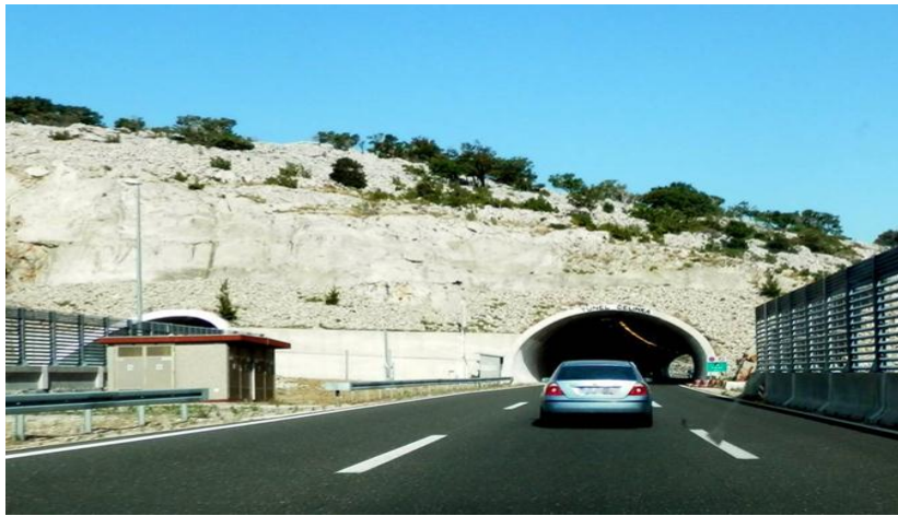
Slika 12. Tunel Čelinka