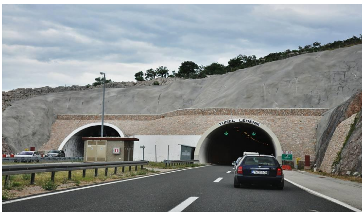
Slika 10. Tunel Ledenik