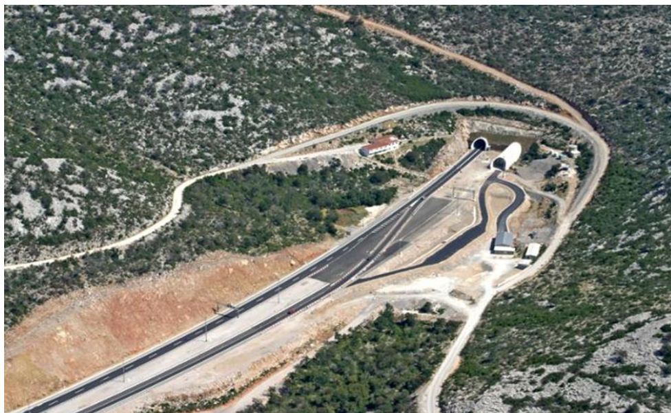
Slika 28. Tunel Sv. Rok