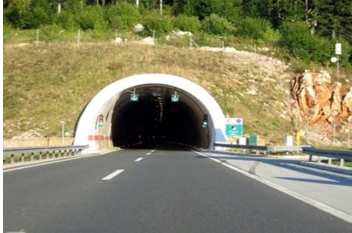
Slika 6. Tunel Plasina