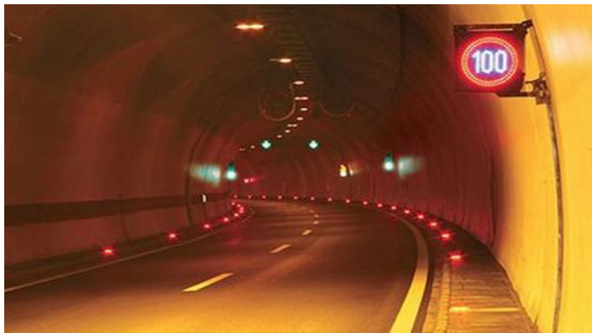
Slika 4. Tunel Brinje