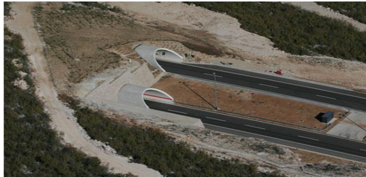
Slika 18. Tunel Stražina