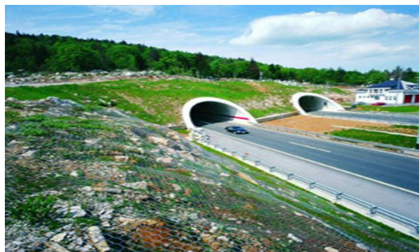
Slika 19. Tunel Sv. Ilija