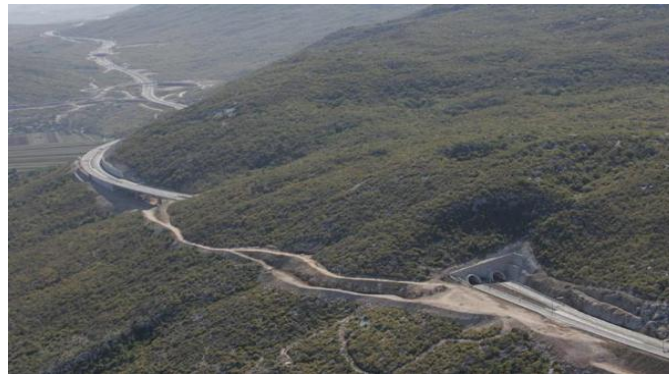
Slika 16. Tunel Bisko