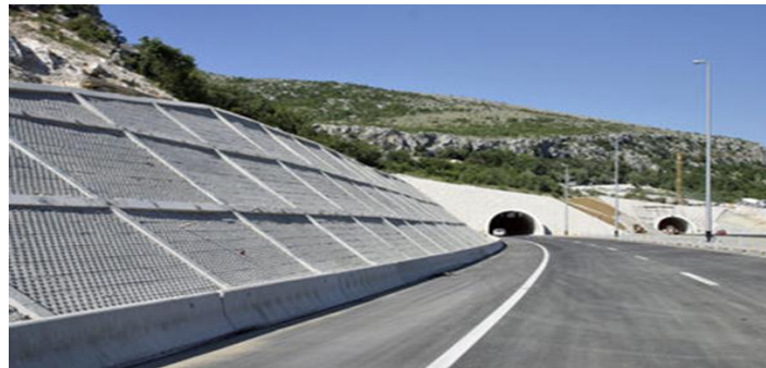
Slika 14. Tunel Konjsko