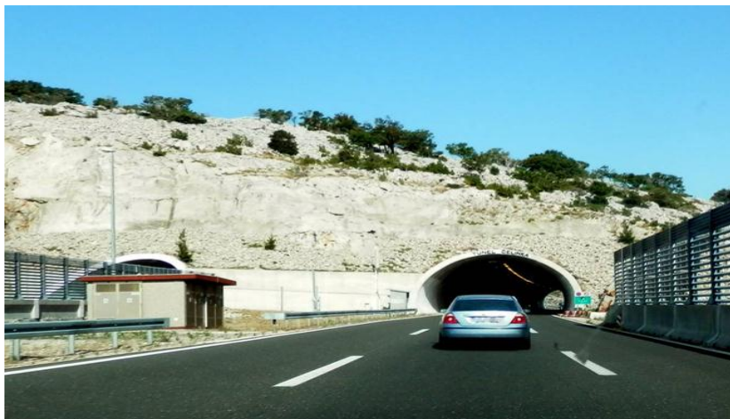
Slika 12. Tunel Čelinka