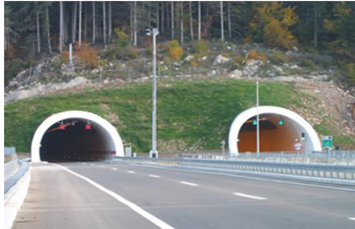
Slika 25. Tunel Plasina