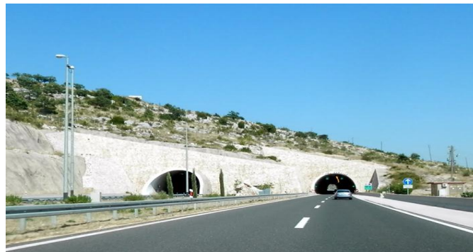
Slika 15. Tunel Zaranač