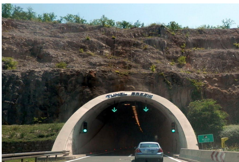
Slika 24. Tunel Brezik