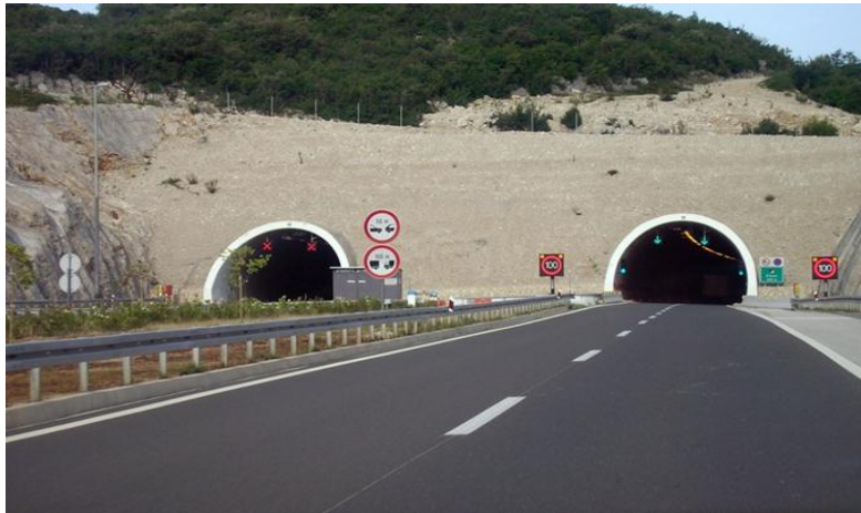
Slika 20. Tunel Umac