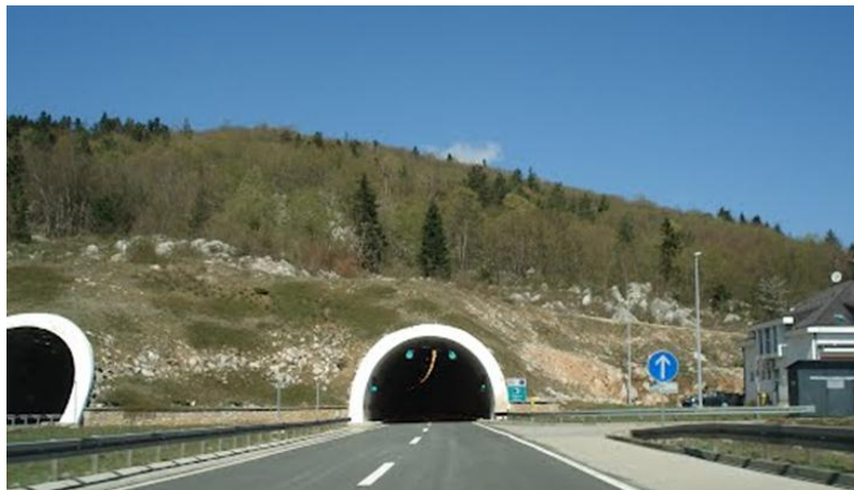
Slika 7. Tunel Grič