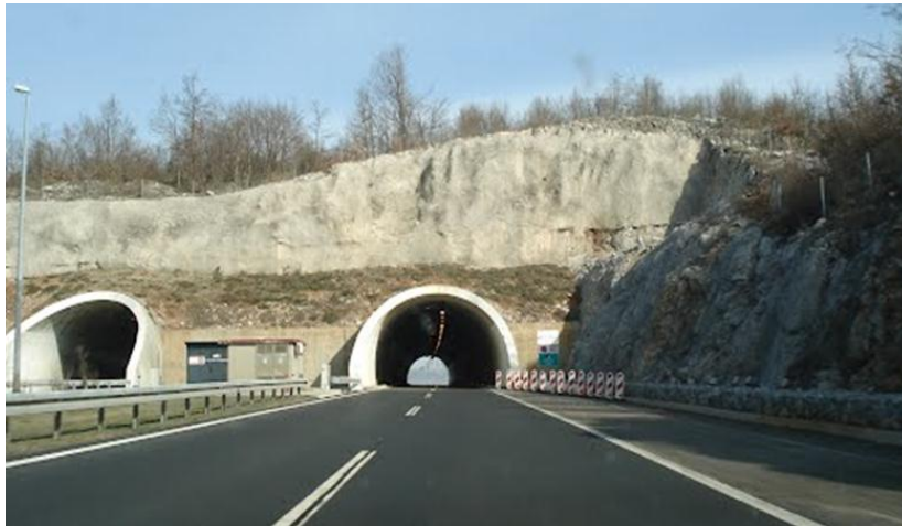
Slika 8. Tunel Krpani