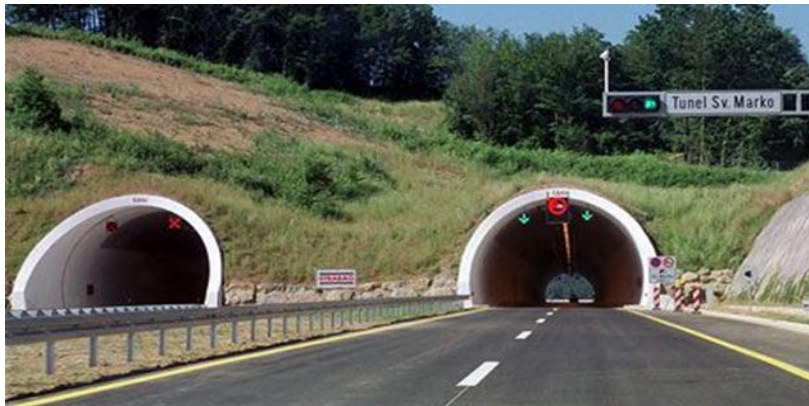
Slika 2. Tunel Sv. Marko