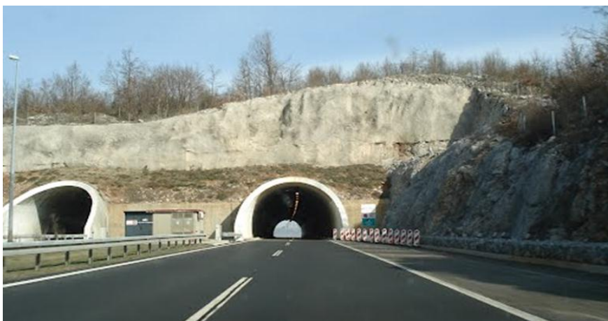
Slika 27. Tunel Krpani