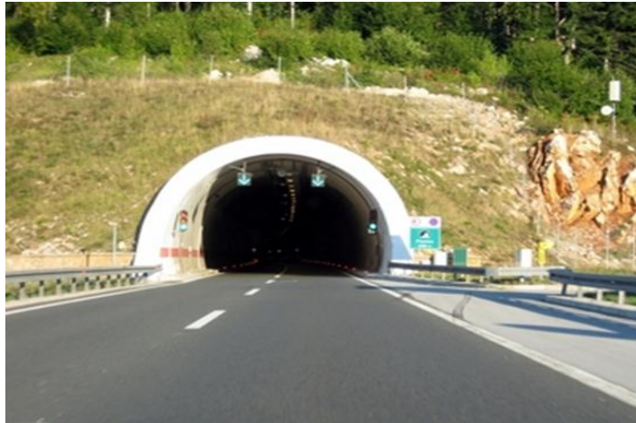
Slika 6. Tunel Plasina