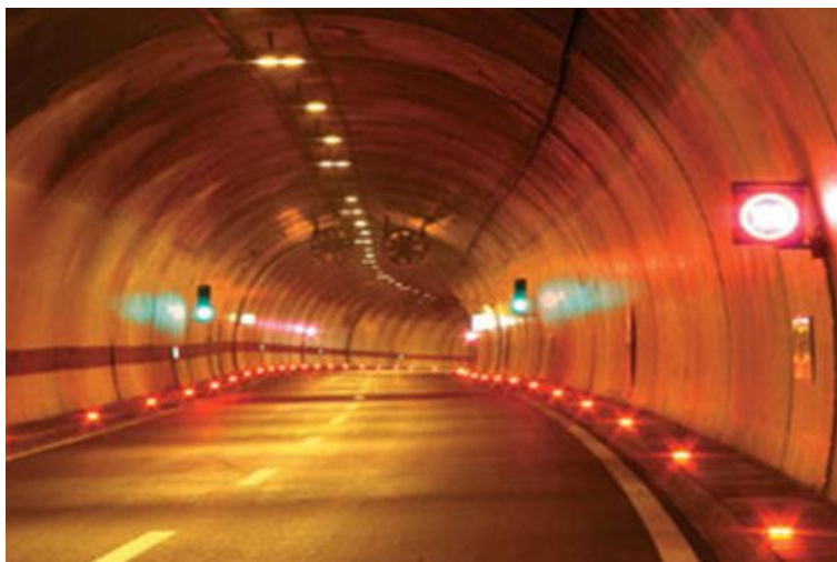
Slika 23. Tunel Brinje