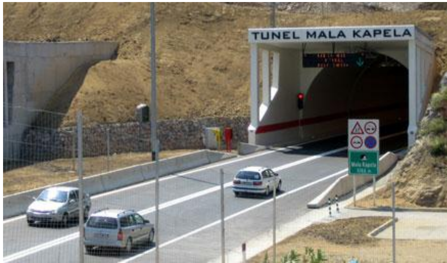
Slika 22. Tunel Mala Kapela