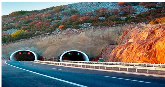
Slika 11. Tunel Bristovac