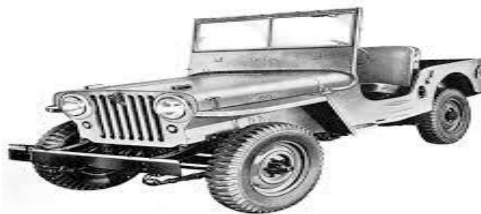
Slika 1. Willys džip