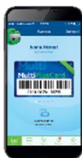
Slika 6 MultiPlusCard mobilna aplikacija