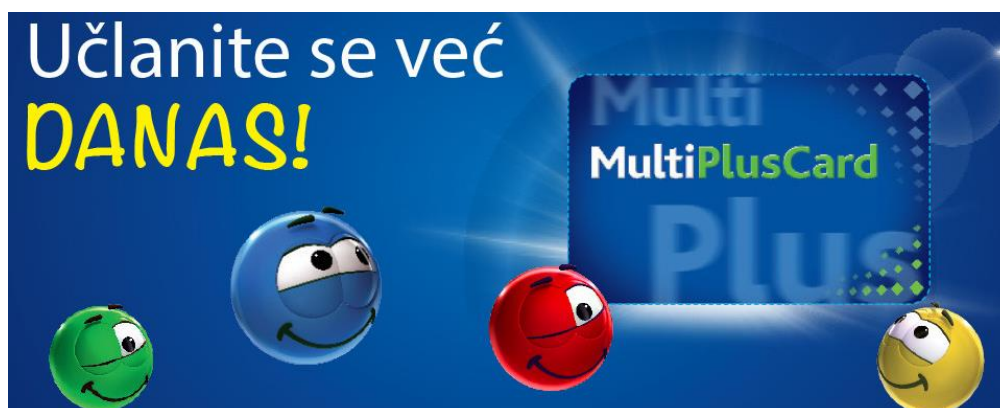
Slika 2 MultiPlusCard kartica