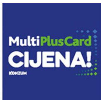
Slika 3 MultiPlusCard cijena