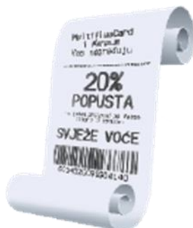
Slika 4 Račun s popustom