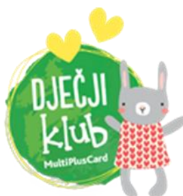
Slika 5 Dječji klub