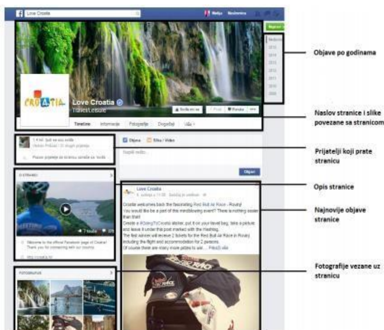
Slika 4 - Izgled vremenske crte na Facebooku