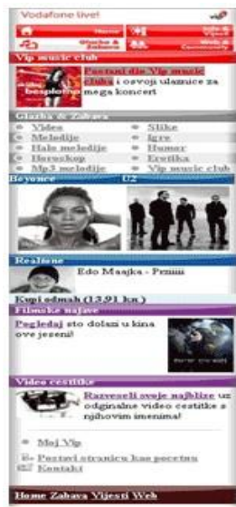
Slika 2 – Vodafone live portal