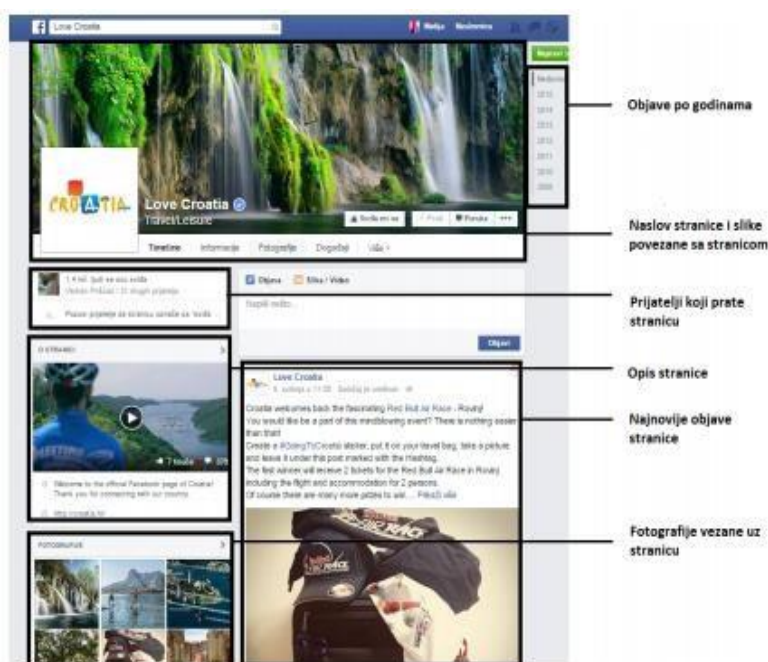
Slika 4 - Izgled vremenske crte na Facebooku