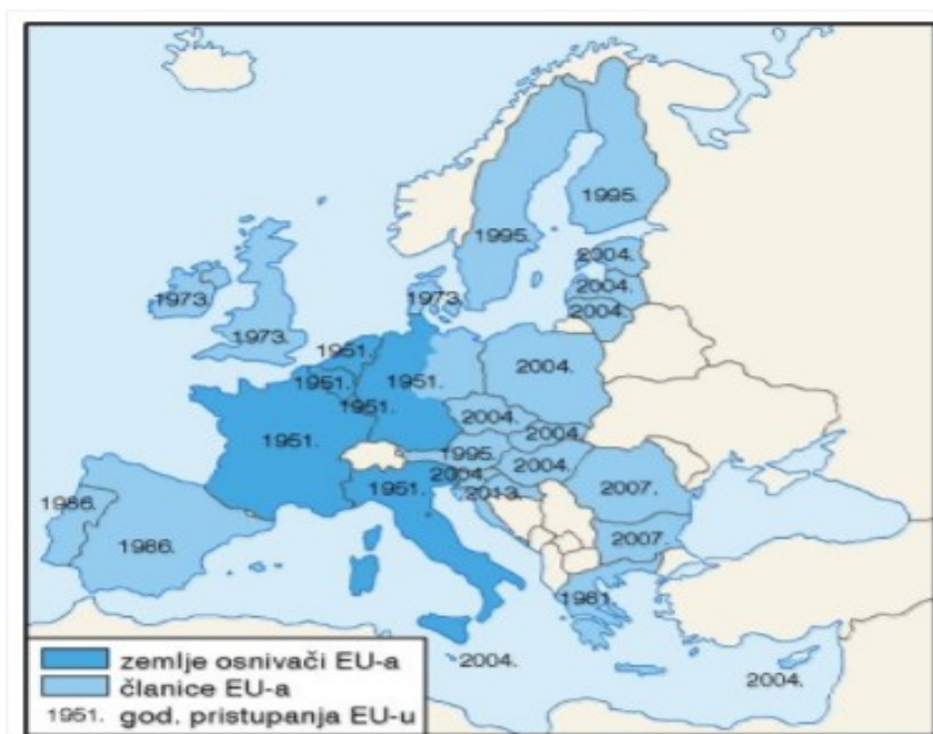
Slika 1 - Države članice EU