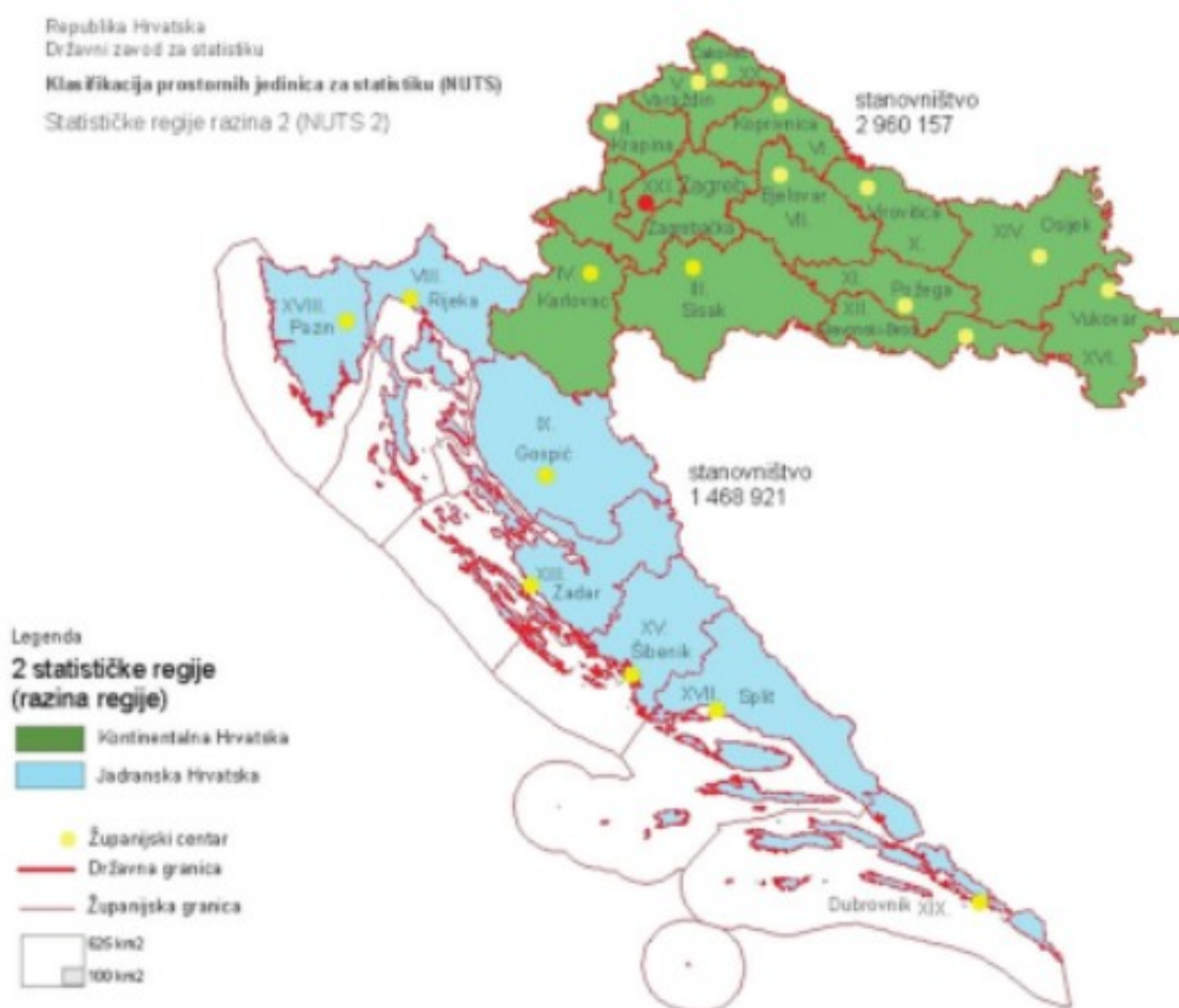
Slika 5 - NUTS II regije u Hrvatskoj