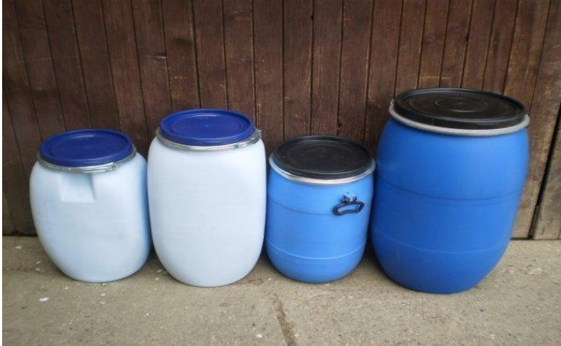
Slika 17. Plastične bačve