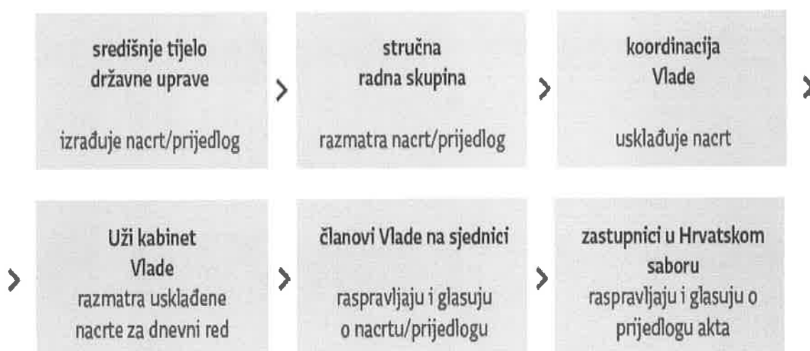
Slika 1. Funkcioniranje Vlade