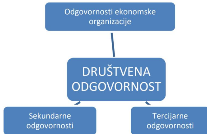
Slika 1. Društvena odgovornost

Tri navedene razine pokrivaju sfere djelovanja poduzeća. Odgovornosti ekonomskog poduzeća odnose se na primarne odgovornosti iste, dakle na obavezu prema zaposlenicima, investitorima (osiguranje produktivnosti, poslovanja i profita) te potrošačima. Sekundarne odgovornosti opisuju obveze prema samim dobavljačima poduzeća (fer odnos, ispunjavanje obveza), lokalnoj zajednici (vraćanje kroz doprinose, društveno koristan rad i humanitarne djelatnosti) u kojoj djeluju te na fizičku okolinu. Kod tercijarne odgovornosti misli se na društvo, odnosno zaposlenost i utjecaj na neposrednu zajednicu. Sve tri razine sačinjavaju društvenu odgovornost te prate i potiču korisnost i dobrobiti svih interesnih dionika od samog početka lanca nabave do krajnjeg korisnika.