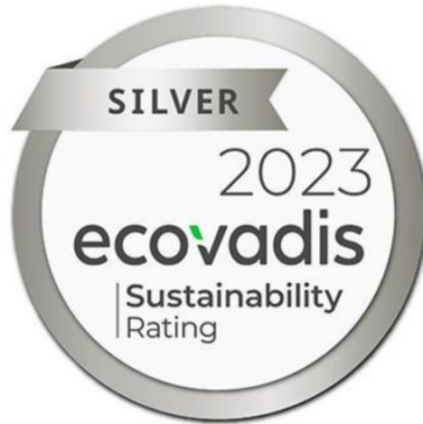
Slika 7. EcoVadis srebrna medalja za održivost

CalcitZeeland dobiva certifikate ISO 9001:2015 I ISO 14001:2015. CalcitZeeland je certificiran prema standardima Međunarodne organizacije za standardizaciju (ISO) 9001:2015 i 14001:2015. Dobivanje ovih certifikata jamstvo je da je Calcit razvio i uveo sveobuhvatan sustav upravljanja kvalitetom te da ima najbolju dostupnu tehnologiju i procese zaštite okoliša u industriji. Kontinuirano poboljšanje učinkovitosti procesa i rada sustava koji je ugrađen u svakodnevne aktivnosti svakog zaposlenika i cijele Calcit Grupe nedavno je potvrđeno certifikatom ISO 9001:2015 i za CalcitZeeland. Nakon potpune vanjske revizije, CalcitZeeland primio je ovaj standard, odražavajući visoki prioritet koji Calcit daje zadovoljstvu svojih kupaca i partnera. Fokus Calcita uvijek je bio razumijevanje kupaca i osluškivanje njihovih potreba i očekivanja, što nije samo središnja tema ovog standarda, već i prioritet uspješnih organizacija. Od prvih planova proizvodnog pogona Zeeland, poduzete su aktivnosti za smanjenje njegovog utjecaja na okoliš, kao što su recikliranje vode, praćenje i smanjenje potrošnje električne energije, osoblje programi podizanja svijesti itd. Dobivanje certifikata ISO 14001:2015 rezultat je posvećenosti okolišu i podizanju svijesti o sigurnosti i zdravlju na radu. Želja za dodatnim povjerenjem kupaca samo je potaknula uvođenje sustava upravljanja kvalitetom i okolišem prema normi ISO 14001.