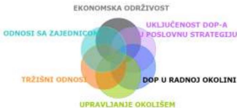
Slika 5. Dimenzije indeksa DOP-a