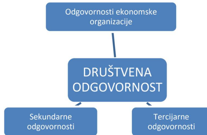
Slika 1. Društvena odgovornost

Tri navedene razine pokrivaju sfere djelovanja poduzeća. Odgovornosti ekonomskog poduzeća odnose se na primarne odgovornosti iste, dakle na obavezu prema zaposlenicima, investitorima (osiguranje produktivnosti, poslovanja i profita) te potrošačima. Sekundarne odgovornosti opisuju obveze prema samim dobavljačima poduzeća (fer odnos, ispunjavanje obveza), lokalnoj zajednici (vraćanje kroz doprinose, društveno koristan rad i humanitarne djelatnosti) u kojoj djeluju te na fizičku okolinu. Kod tercijarne odgovornosti misli se na društvo, odnosno zaposlenost i utjecaj na neposrednu zajednicu. Sve tri razine sačinjavaju društvenu odgovornost te prate i potiču korisnost i dobrobiti svih interesnih dionika od samog početka lanca nabave do krajnjeg korisnika.