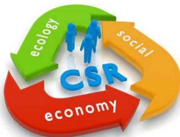
Slika 2. Društveno odgovorno poslovanje

Portal DOP.hr navodi da „prema Svjetskom poslovnom savjetu za održivi razvoj, društvena se odgovornost poduzeća definira kao predanost gospodarstva da pridonese održivom ekonomskom razvoju radeći s ljudima, njihovim obiteljima, lokalnom zajednicom i društvom općenito kako bi svi mogli poboljšati uvjete u kojima žive.“ Isti portal također navodi definiciju Europske komisije koja definira društvenu odgovornost poduzeća kao „koncept putem kojeg poduzeća integriraju društvene i ekološke ciljeve u svoje poslovne aktivnosti te odnose s dionicima na dobrovoljnoj osnovi.“