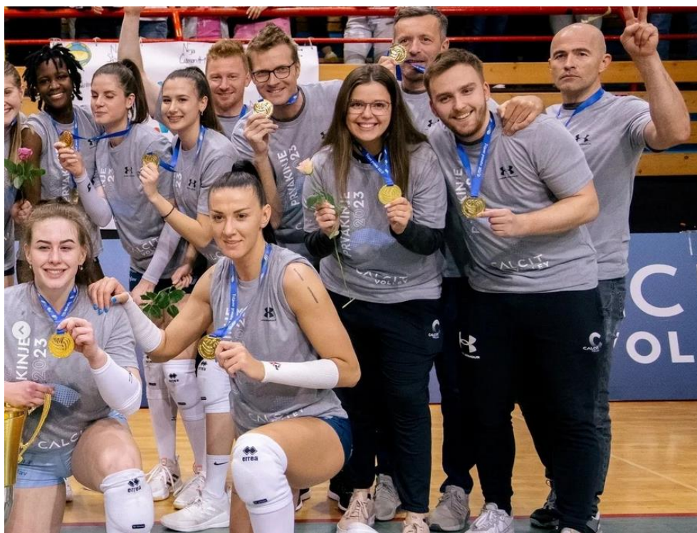
Slika 6. CalcitVolley - državne prvakinje2022/2023

Dugi niz godina sponzoriraju lokalni sport, pridonose njegovom razvoju i vjerno navijaju za sportaše. Calcitova sportska obitelj broji preko tisuću sportaša koji se natječu u odbojci (slika), brdskom biciklizmu, plivanju, vaterpolu, boćanju, snowboardu, rekreativnim sportovima.