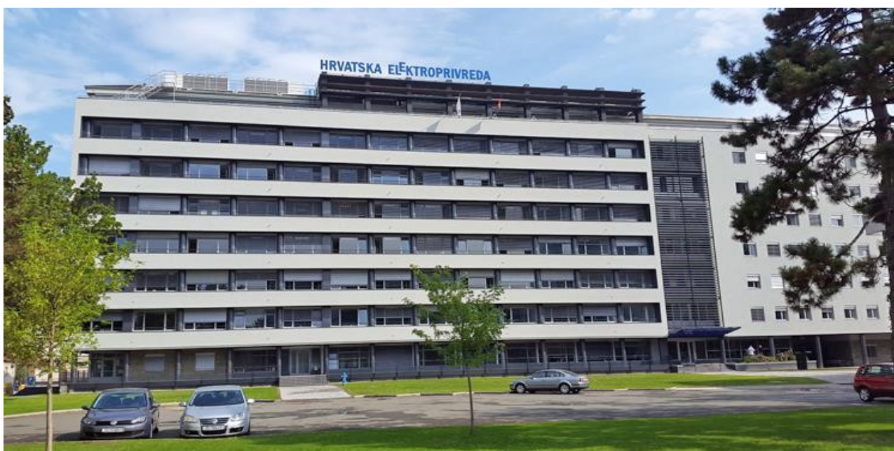
Slika 2. Sjedište HEP-a