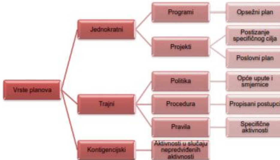
Tablica 1 – Vrste Poslovnih planova

Izvor: Pfeifer, S., Jeger, M., Interna skripta za kolegij Menadžment, Sveučilište Josipa Jurja Strossmayera u Osijeku, Ekonomski fakultet, Osijek, 2012.