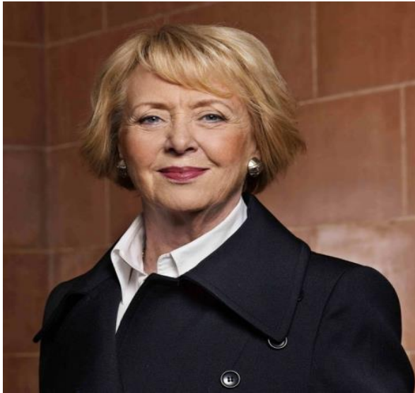
Slika 3. Vigdis Finnbogadottir