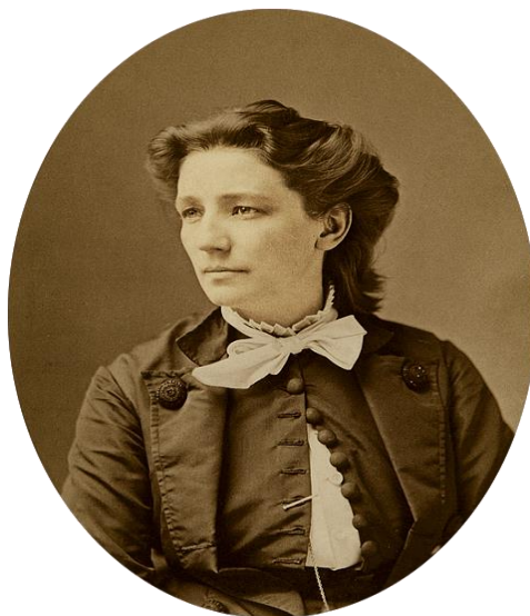
Slika 2. Victoria Woodhull

Izvor: https://www.pinterest.com/algonquinbooks/victoria-woodhull/ (22.04.2017.)