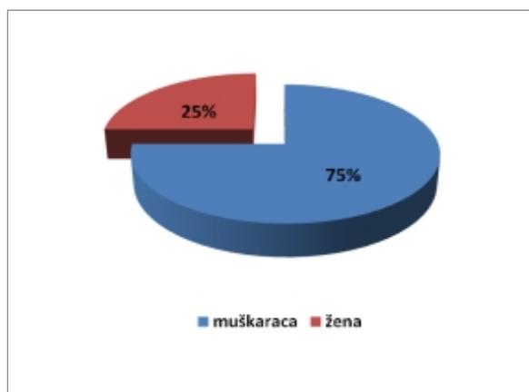
Graf 2. Zastupljenost muškaraca i žena u Hrvatskom Saboru