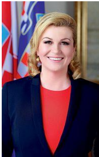
Slika 1. Kolinda Grabar-Kitarović