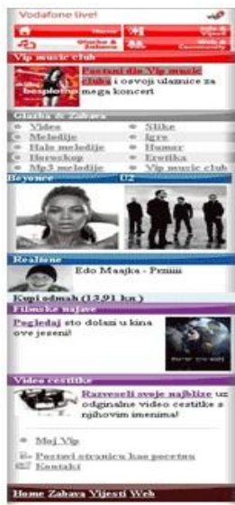
Slika 2 – Vodafone live portal