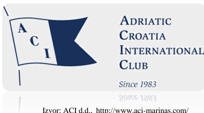
Slika 3.: Logo poduzeća ACI d.d.

Predmet poslovanja ACI d. d. je organiziranje i pružanje usluga vezova plovilima u marinama duž hrvatske obale, kao i ostale djelatnosti vezane uz iznajmljivanje, gradnju i popravak plovila i ostalo. U svrhu korištenja pomorskog dobra Vlada Republike Hrvatske je dodijelila koncesije, na temelju kojih je na tom dobru izgrađena 21 marina. Na dan 31. prosinca 2014. godine društvo je imalo 354 zaposlenika. (ACI d. d., Godišnje izvješće za 2014., Zagrebačka burza, http://zse.hr/userdocsimages/financ/ACI-fin2014-1Y-REV-N-HR.pdf , 2. 7. 2015.)