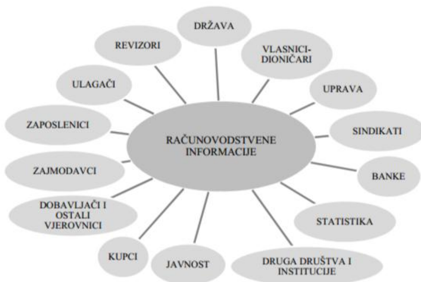
Slika 1: Korisnici financijskih izvještaja i ostalih računovodstvenih informacija

Izvor: Belak, Vinko (2002), Osnove profesionalnog računovodstva , Veleučilište u Splitu, Split, str. 37.