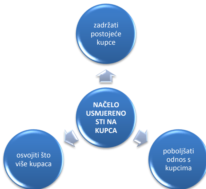
Shema 1. Načelo usmjerenosti kupca

Izvor: Kuliš Šiško, M., „ Utjecaj osposobljenosti tvrtki na primjenu TQM-a na efikasnost poslovanja u elektroenergetskom sektoru Republike Hrvatske “, Magistarski rad, Sveučilište u Splitu, Split, 2009., https://bib.irb.hr/datoteka/411699.Magisterij_-_predano.pdf , 66. (07.04.2015.)