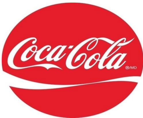
Slika 3: Logo Coca – Cola

Coca - Cola HBC Hrvatska jedna je od najvećih tvrtki u industriji bezalkoholnih napitaka u državi. Ovlaštena je punionice tvrtke The Cola-Cola Company. Coca-Cola se u Hrvatskoj počela proizvoditi 1968. godine sa sjedištem tvrtke u Zagrebu, a poslije se proširiva na još dvije punionice te zapošljava preko 700 ljudi.