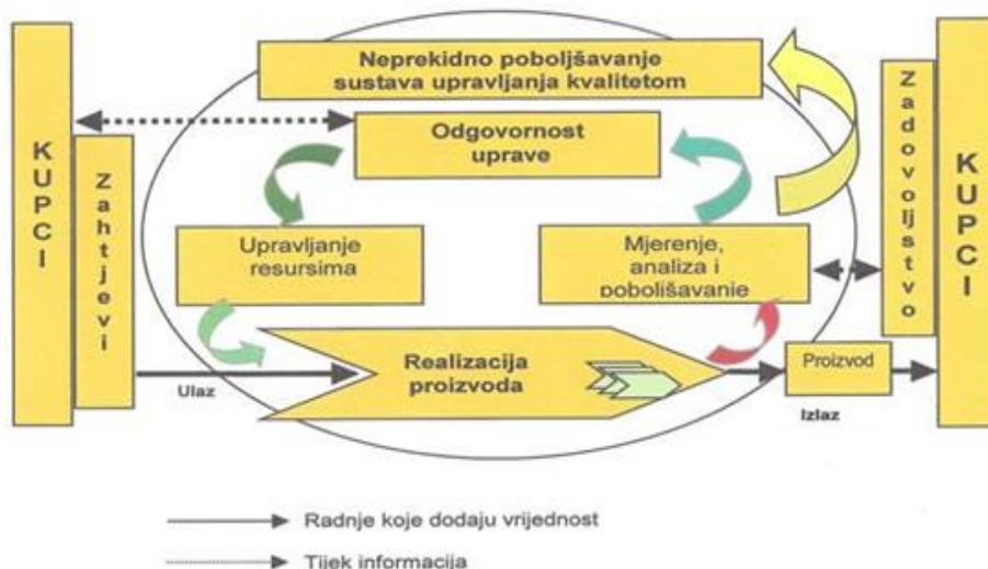
Slika 1: Procesni pristup upravljanja kvalitetom

Elementi ili kriteriji kvalitete proizlaze iz biti kvalitete različitih vrsta proizvoda, usluga, aktivnosti, ovisno o njihovoj upotrebi, korisnosti, važnosti za kupca/potrošača. Kvaliteta je grozd koji ima više bobica, sve su jednako važne jer sve one čine 100%-tnu kvalitetu, da i jedna bobica nedostaje ili nije u potpunosti zdrava i lijepog izgleda, nema potpune kvalitete (Avelini Holjevac, 2003.).