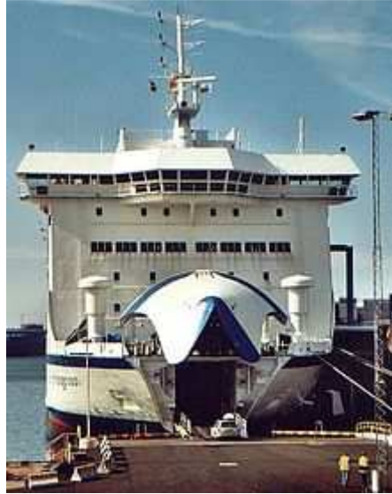
Slika 6. Ro – Ro brod s pokretnim pramcem za horizontalni pristup vozila u utrobu broda

posebno dolaze do izražaja u uvjetima zakrčenosti pojedinih luka, a njihove prednosti još više se povećavaju specijalnim terminalima.