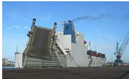
Slika 7. Ro – Ro brod

Izvor: http://hr.wikipedia.org/wiki/Ro-Ro_brod