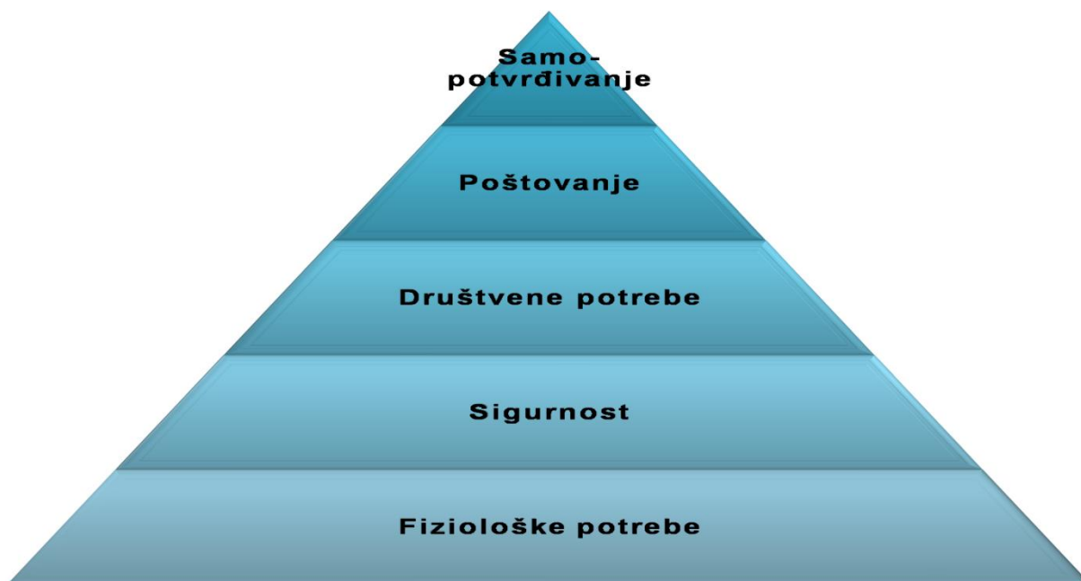
Slika 3 hierarhija ljudskih potreba