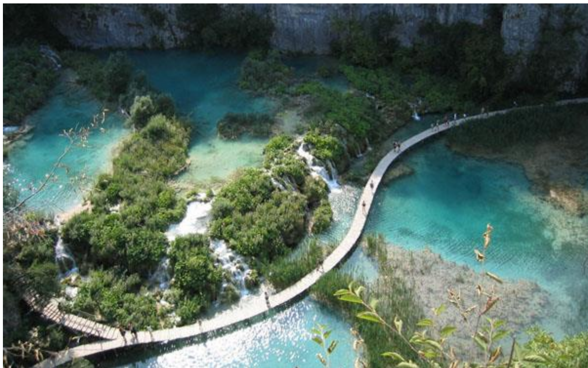
Slika 4 Plitvička jezera