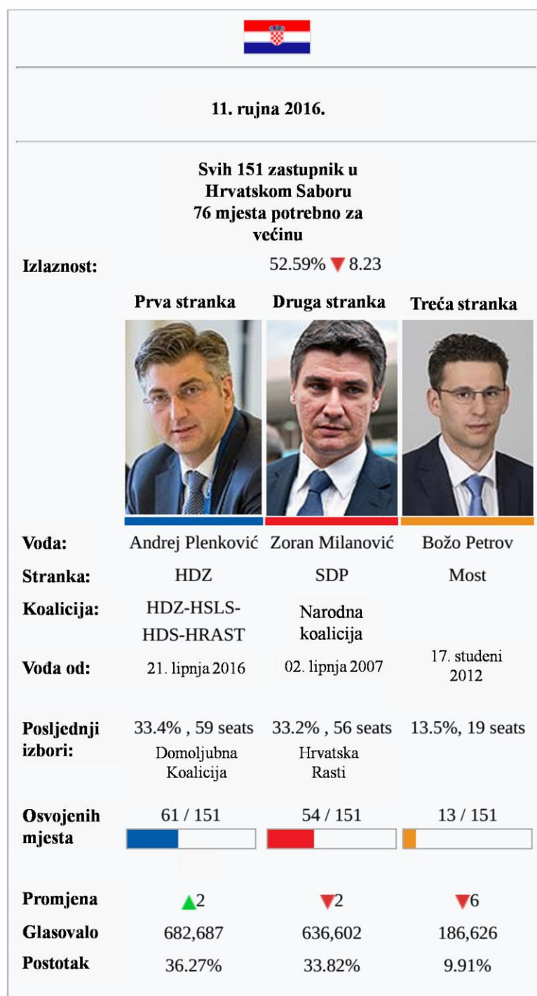
Slika 2 Rezultati na izborima za Sabor 11. rujna 2016

( https://en.wikipedia.org/wiki/Croatian_parliamentary_election,_2016 14.08.2017.).