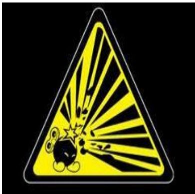
Slika 2. Eksplozivna tvar