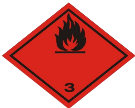
Slika 5. Zapaljive tekućine