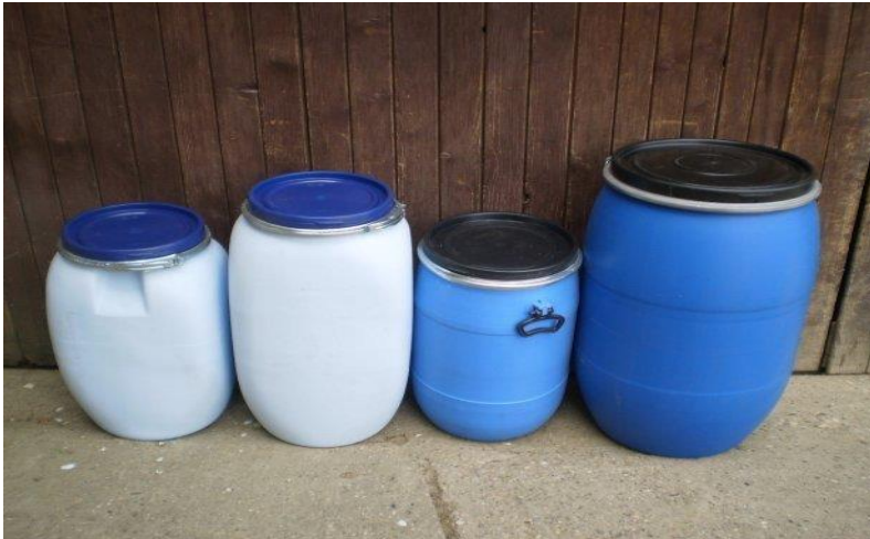
Slika 17. Plastične bačve