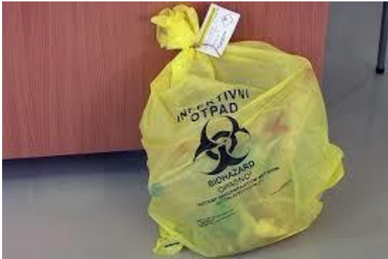
Slika 19. Primjer vreće za otpad opasnih tvari