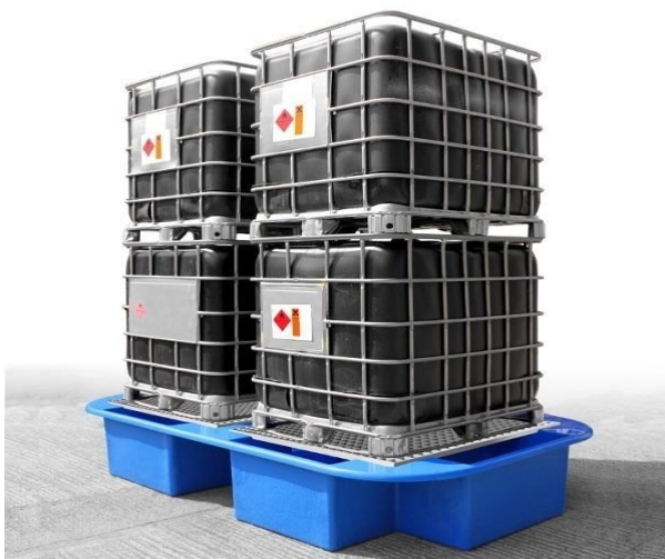
Slika 22. IBC spremnici