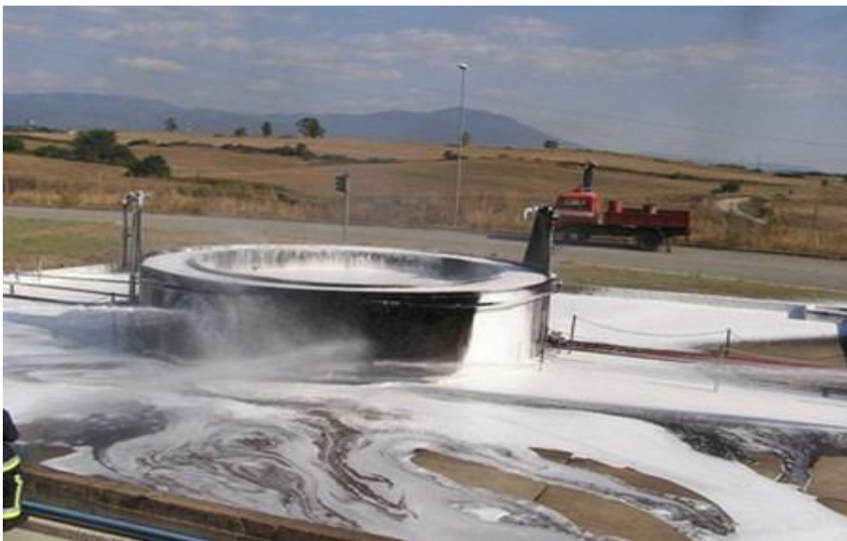
Slika 26. Prekrivanje pjenuom

https://www.vatrogasci-rijeka.hr/hr/gasenje_pozara_spremnika_lako_zapaljivih_tekucina/984/16