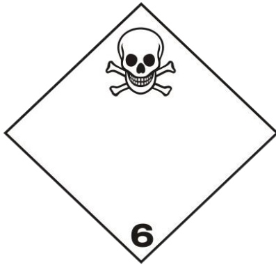
Slika 11. Otrovnne tvari