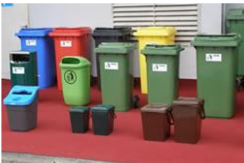
Slika 18. Primjer kante