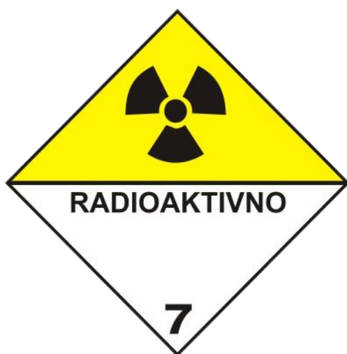
Slika 13. Radioaktivne tvari