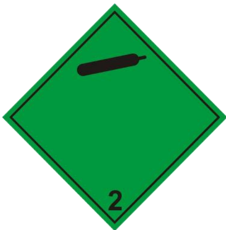
Slika 4. Nezapaljivi, neotrovni plinovi