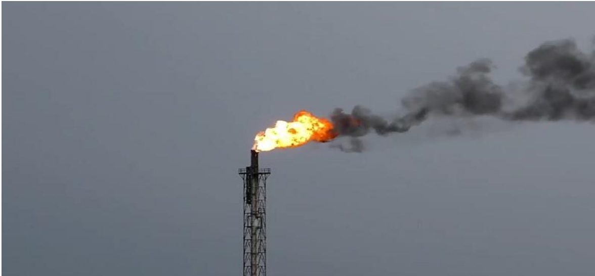
Slika 28. Spaljivanje na baklji

Baklje upotrebljavaju otvoreni plamen tijekom normalnog rada u izvanrednim uvjetima za spaljivanje opasnih plinova. Sustav nema posebne značajke za kontrolu temperature ili vremena izgaranja, međutim, može biti potrebno dodatno gorivo za održavanje izgaranja. [12]