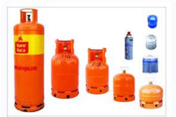
Slika 21. Boce za plin