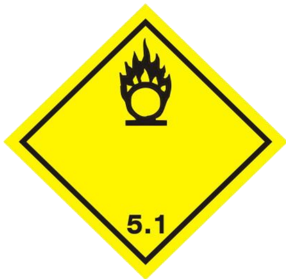
Slika 9. Oksidirajuća tvar