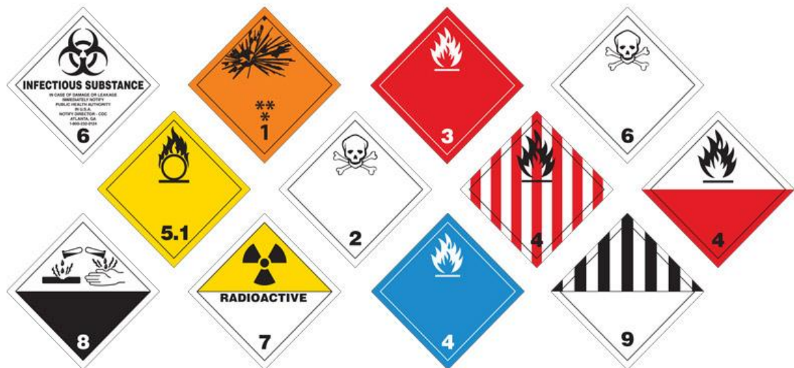
Slika 1. Klase opasnih tvari