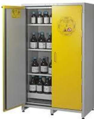
Slika 20. Primjer sanduka