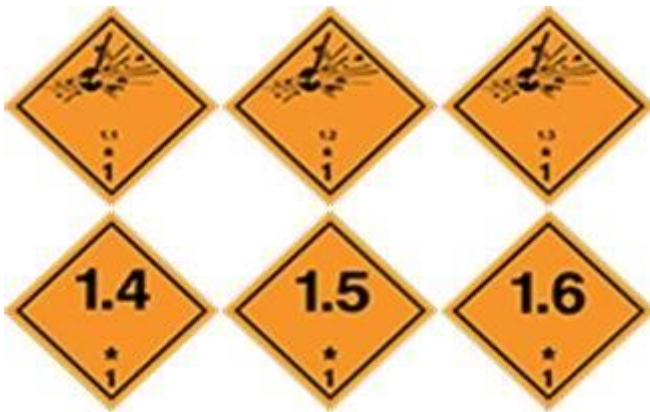
Slika 3. Eksplozivne tvari