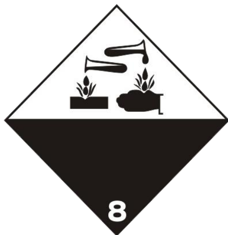
Slika 14. Korozivne ili nagrizajuće tvari