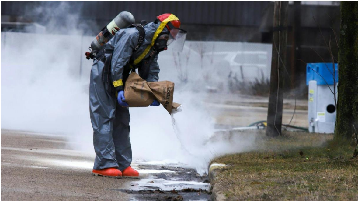
Slika 27. Neutralizacija