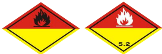
Slika 10. Organski peroksidi