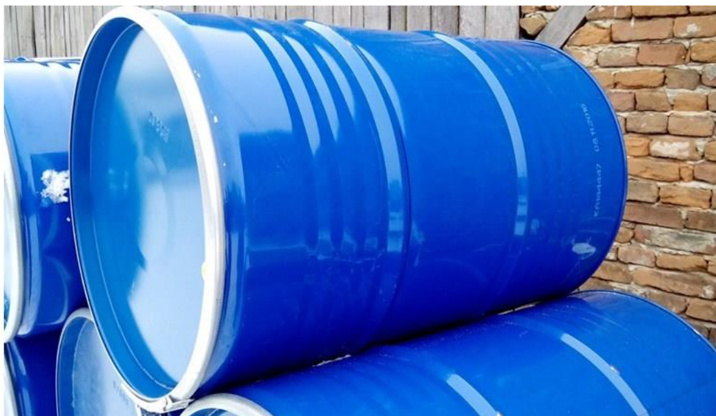
Slika 16. Bačva od čeličnog lima