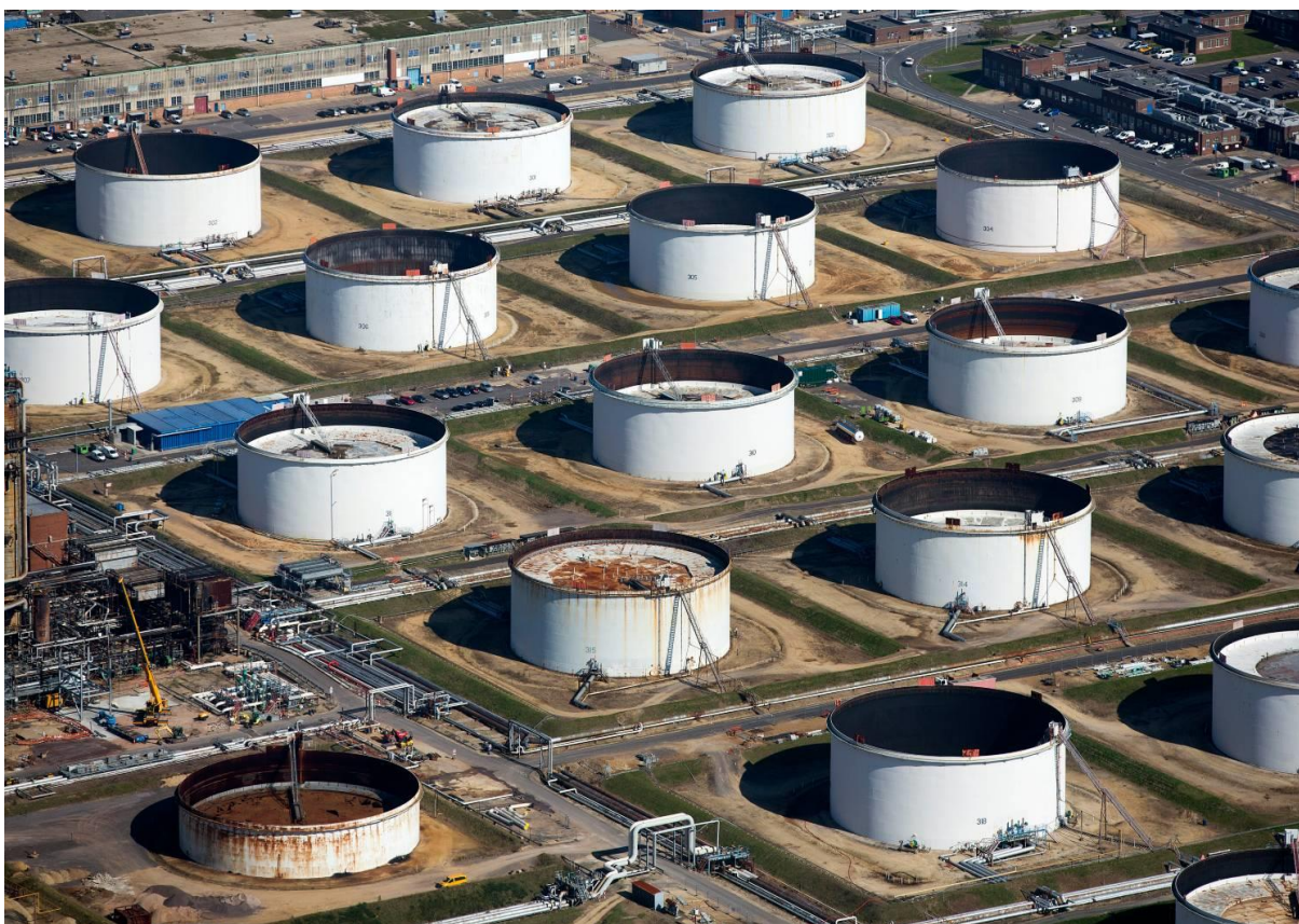
Slika 24. Spremnici za skladištenje nafte

http://cmjp.rs/wp-content/uploads/2020/04/491404556.jpg