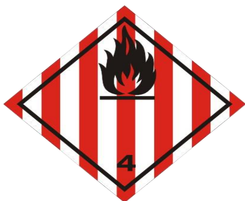
Slika 6. Zapaljive krutine, samoreaktivne tvari i desenzibilizirani eksplozivi

Izvor: http://www.znakovi.com.hr/osnovneOpasnosti/osnovneOpasnosti.html