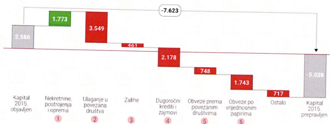
Slika 4 : Promjene kapitala kompanije Konzum d.d. na temelju rezultata revizije