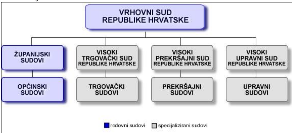
Slika 2 Ustroj sudbene vlasti u RH