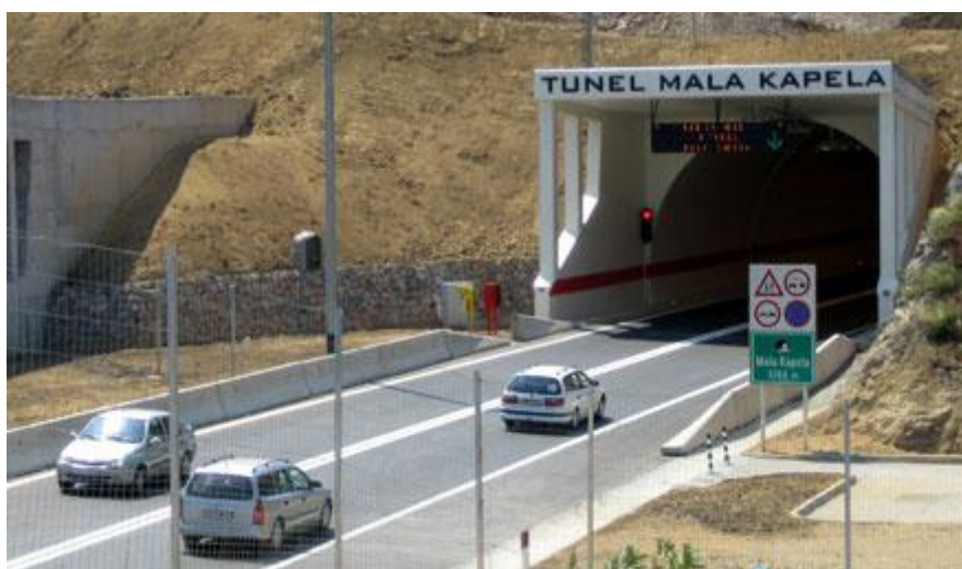
Slika 22. Tunel Mala Kapela