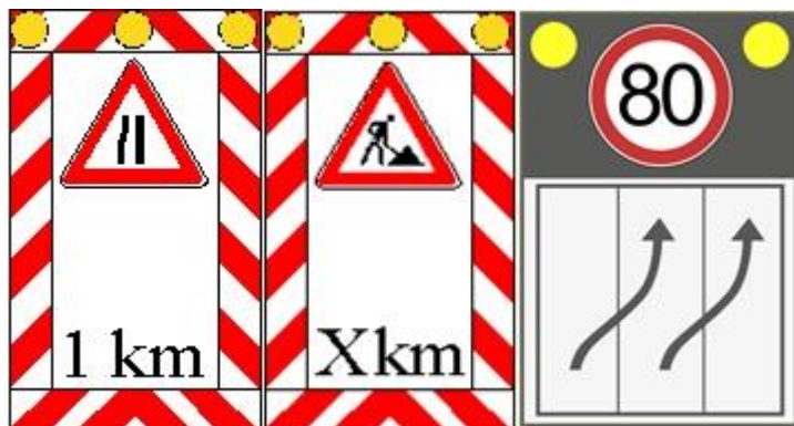
Slika 3. Pokretna signalna ploča s promjenjivim sadržajem , upozorava na blizinu mjesta na cesti na kojemu se izvode radovi ili gdje se preusmjeruje promet na jedan prometni trak

Mobilna signalizacija se može promijeniti na svakom tipu prometnice. U naseljima se koristi uglavnom prilikom zaštite područja izvođenja radova na prometnici, označavanja prepreka na prometnici ili kod regulacije prometa u slučaju prometne nezgode.