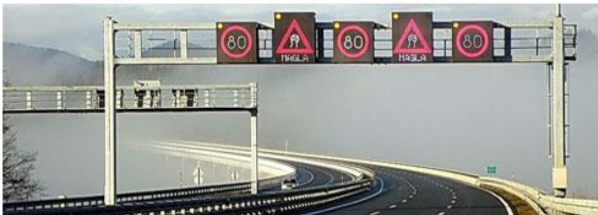
Slika 6. Najava opasnosti na cesti