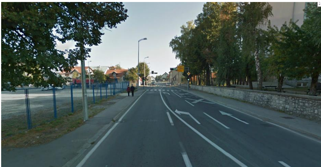
Slika 9. Smjer 2 Budačka ulica