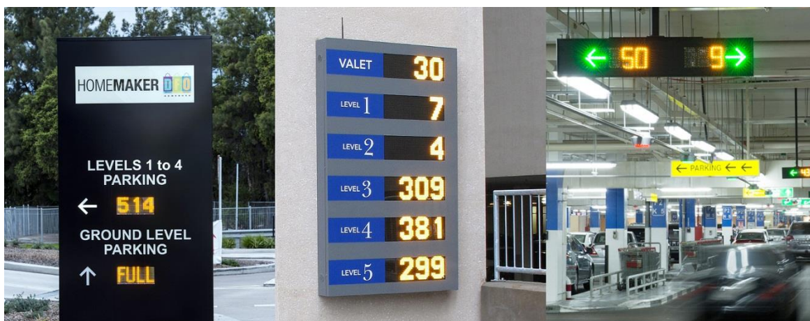
Slika 5. LED oznake za parkiralište i garaže

izbjegavanja prometnih gužvi. LED oznake za parkiralište i garaže najčešće se upotrebljavaju u svrhu informiranja vozača o stanju u parkirališnoj garaži, broju slobodnih mjesta i broju etaža garaže. Veliku promjenu im osigurava i veliki rast novoizgrađenih parkirališnih garaža u velikim urbanim gradskim centrima. LED promjenjive prometne znakove moguće je regulirati ručno ili automatsko. Također je moguće i daljinsko upravljanje znakovima. Izvor napajanja energijom može biti iz solarnih panela, što dodatno osigurava trajnost izvora energije i njegovu pouzdanost.