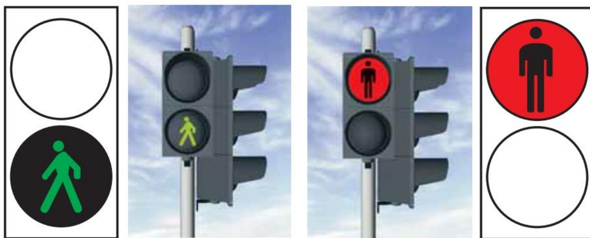
Slika 1. Prometna svjetla namijenjena pješacima

U skladu sa zakonom o sigurnosti prometa na cestama, promjenjivim prometnim znakovima daju se izmjenično svjetlosni znakovi crvenim i zelenim svjetlom. Zeleno svjetlo može biti podešeno tako da trepće kratko vrijeme i prije same promjene. Crveno i zeleno svjetlo nikako ne mogu biti upaljeni istodobno. Na crvenim svjetlosnim poljima znaka strelica smjera je crna, a na zelenim svjetlosnim poljima znaka strelice se uvijek prikazuju kao zelene svjetlosne strelice na crnoj podlozi.