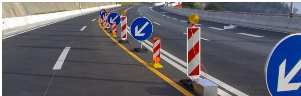
Slika 7. Upozorenje da je jedna ili više prometnih traka zatvorena i da je promet preusmjeren »putovanjem svjetla«