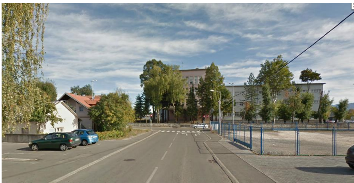
Slika 8. Smjer 1 Zagrebačka ulica

Raskrižje Zagrebačke i Budačke ulice u gradu Gospiću je trokrako raskrižje. Budačka ulica je jedna od najopterećenijih ulica u gradu Gospiću. Ima tri privoza. Glavna ulica je Budačka ulica dok je Zagrebačka sporedna ulica. Budačka ulica sadrži dvije prometne trake, koje se ispred raskrižja granaju na traku namijenjenu za kretanje vozila ravno i prometnu traku za kretanje vozila u lijevo gledano iz smjera juga, odnosno u desno gledano iz smjera sjevera. Zagrebačka ulica sadrži dvije prometne trake, koje se ispred raskrižja granaju u traku namijenjenu za kretanje vozila u lijevo i prometnu traku za kretanje vozila u desno. Promet u navedenom raskrižju reguliran je uređajima za davanje svjetlosnih signala u prometu (semaforima), dok u slučaju isključenja semafora promet je reguliran prometnim znakovima.