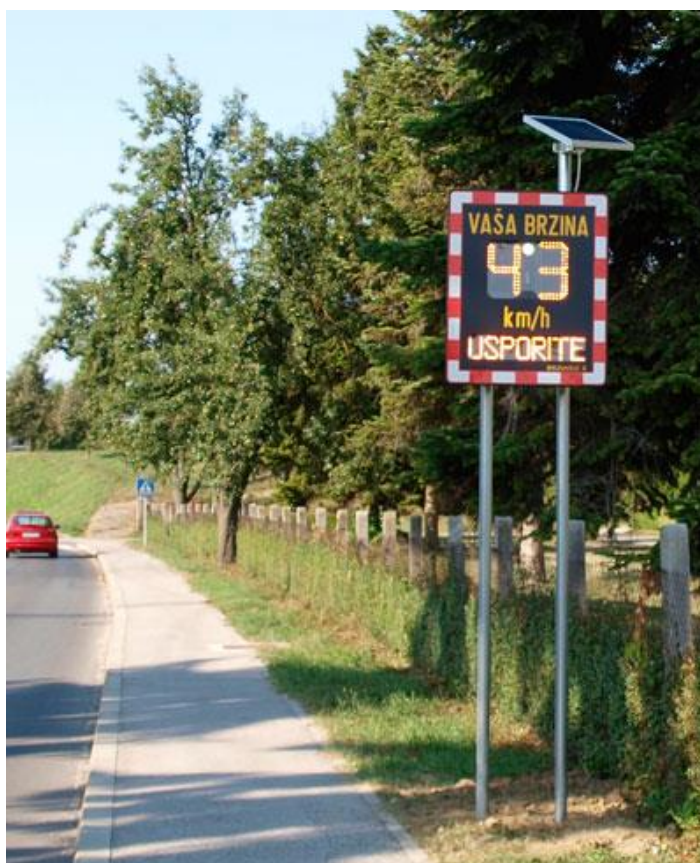
Slika 11. Radarski pokazivač brzine

Na ulazu u grad Gospić, prije raskrižja Budačke i Zagrebačke ulice nalazi se promjenjivi prometni znak koji mjeri brzinu kretanja vozila te ju prikazuje vozačima. Radarski pokazivač brzine je interaktivni znak, obično izrađen od niza LED dioda, koji prikazuje brzinu vozila dok se vozači približavaju. Svrha ovog promjenjivog prometnog znaka je spriječiti vozila tako što će vozači biti svjesni kada voze brzinom iznad dozvoljenih granica. Koriste se kao sredstvo za smirivanje prometa uz ili umjesto fizičkih uređaja kao što su umjetne izbočine, vibracijske trake te trake za zvučno upozoravanje vozača.