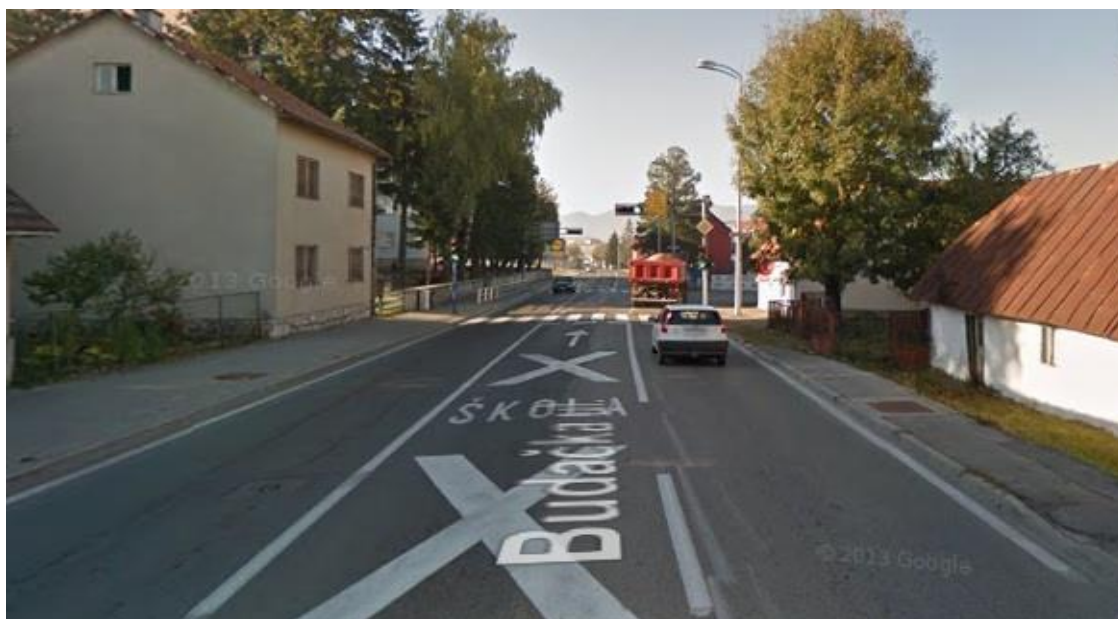
Slika 10. Smjer 3 Budačka ulica