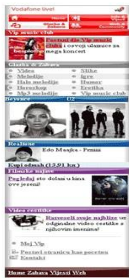
Slika 2 – Vodafone live portal