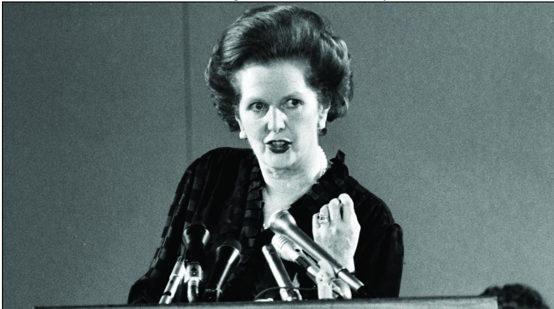
Slika 2 Margaret Thatcher – Čelična lady

Na Zapadu su žene u drugoj polovici 20. stoljeća postigle napredak, ali muškarci još uvijek imaju vodeće uloge u zakonima, politici, poslovanju i industriji. Jednostavno može se zaključiti da ženska prava nisu dosegla jednakost s ljudskim pravima, tj. s pravima koje muškarci imaju i primjenjuju ih u svojim životima. Žene tako rade potplaćene poslove, često su žrtve zlostavljanja i na radnim mjestima puno teže dolaze uopće do radnih mjesta.