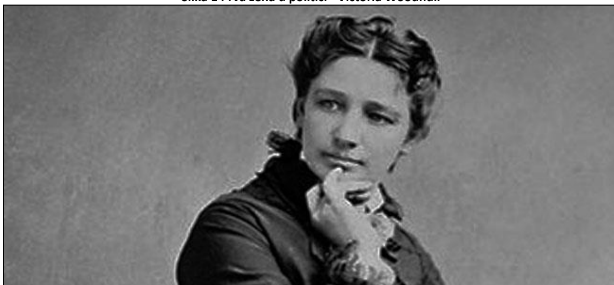
Slika 1 Prva žena u politici - Victoria Woodhull

U drugoj polovici 20. stoljeća sve više žena ulazi u politiku pa se tako pojavljuje i prvo premijerka Sirimavo Bandaranaike u Šri Lanci 1960. godine. Nakon nje Indira Ghandi postaje premijerka 1966. godine u Indiji, a Benazir Bhutto u Pakistanu 1979. godine. Prva predsjednica države postaje Vigdis Finnbogadottir na Islandu 1980. godine.